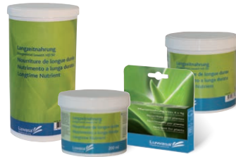
Langzeitnahrung 3-4 Monate Granulat oder Vlies