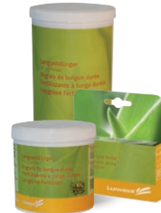
Langzeitdünger 10-12 Monate Granulat oder Vlies