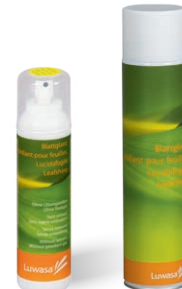
Blattglanz auf Wasserbasis oder als Aerosol

Luwasa Longtime-Produkte erhalten Sie bei Ihrem Fachhändler